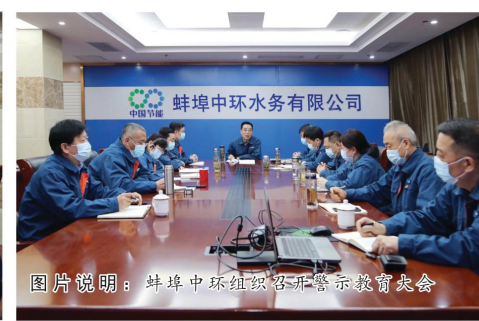
图片说明：蚌埠中环组织召开警示教育大会

二是周密部署各部门制度，落实防控措施。蚌埠中环水务下属各窗口单位积极响应公司防控要求，制定防控细则。窗口单位及重要部门从部门实际出发成立防控领导小组并制定防控工作方案。